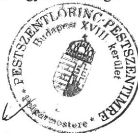
Szaniszló Sándor polgármester