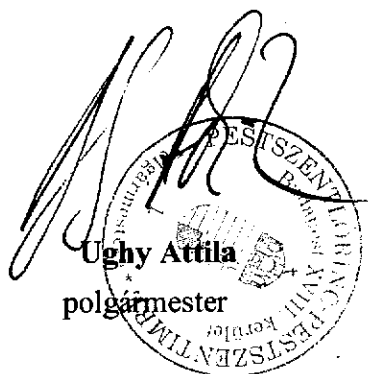
Ughy Attila polgármester

A rendelet 2014. május 15. napján hatálybalépésének dátuma.